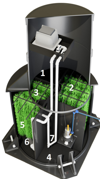
Рис.2 Устройство ЛОС «ЕВРОДиамант ЛОНГ».