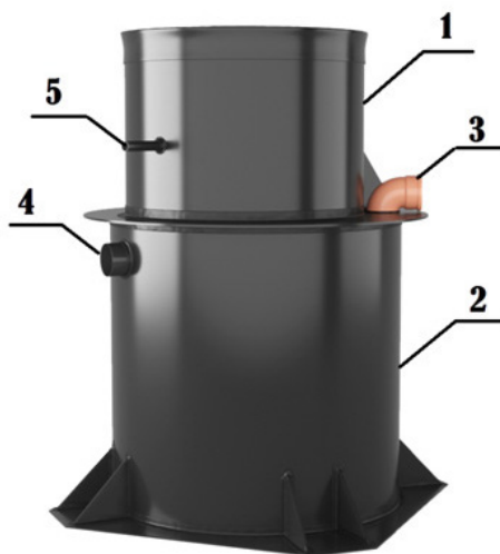
Рис. 1 Общий вид ЛОС «ЕВРОДиамант» 1-технологическая горловина, 2-корпус, 3 –подводящий патрубок, 4-отводящий самотечный патрубок, 5-отводящий напорный патрубок.

• Аварийная световая/звуковая сигнализация. Оповещает о превышении рабочего уровня стоков, затоплении станции.